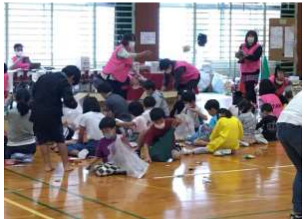
■子供たち大喜びの菓子ほり