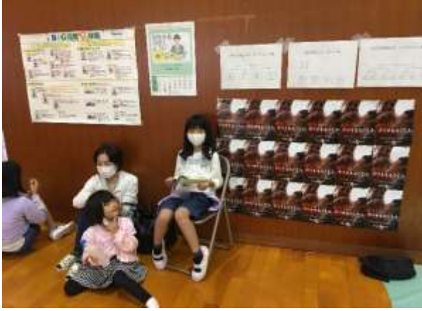
■ポリオ撲滅のポスターをたくさん並べてアピール