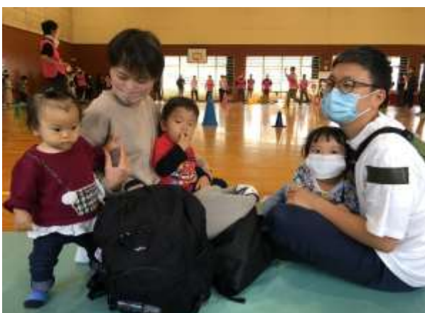
■親子連れの家族団らんのひととき