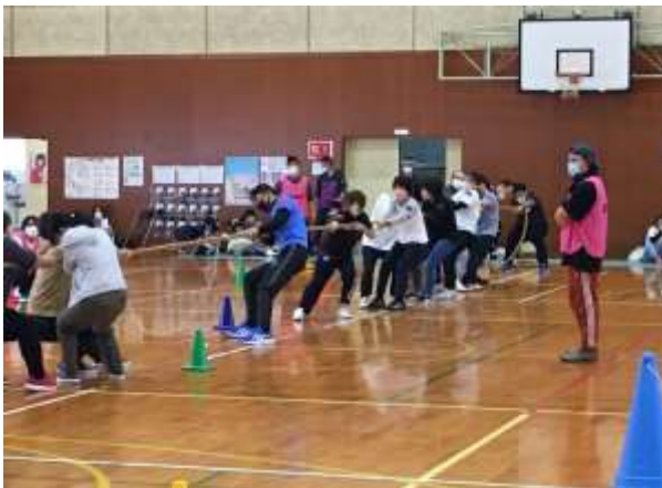
■皆さん本気の綱引き