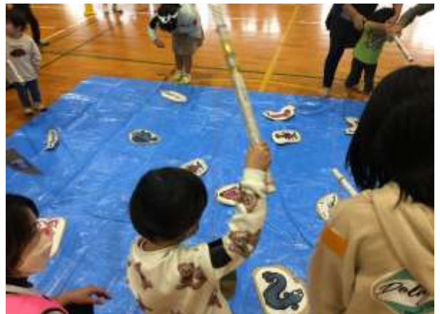
■子供たちに大人気の釣りゲーム