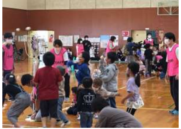
■子供たちの玉入れ