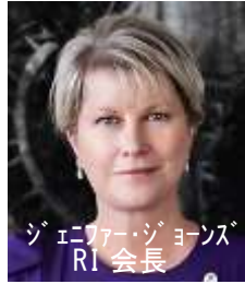
ジェニファー・ジョンズ RI 会長