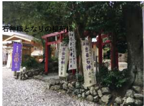
石神様となりの稲荷様