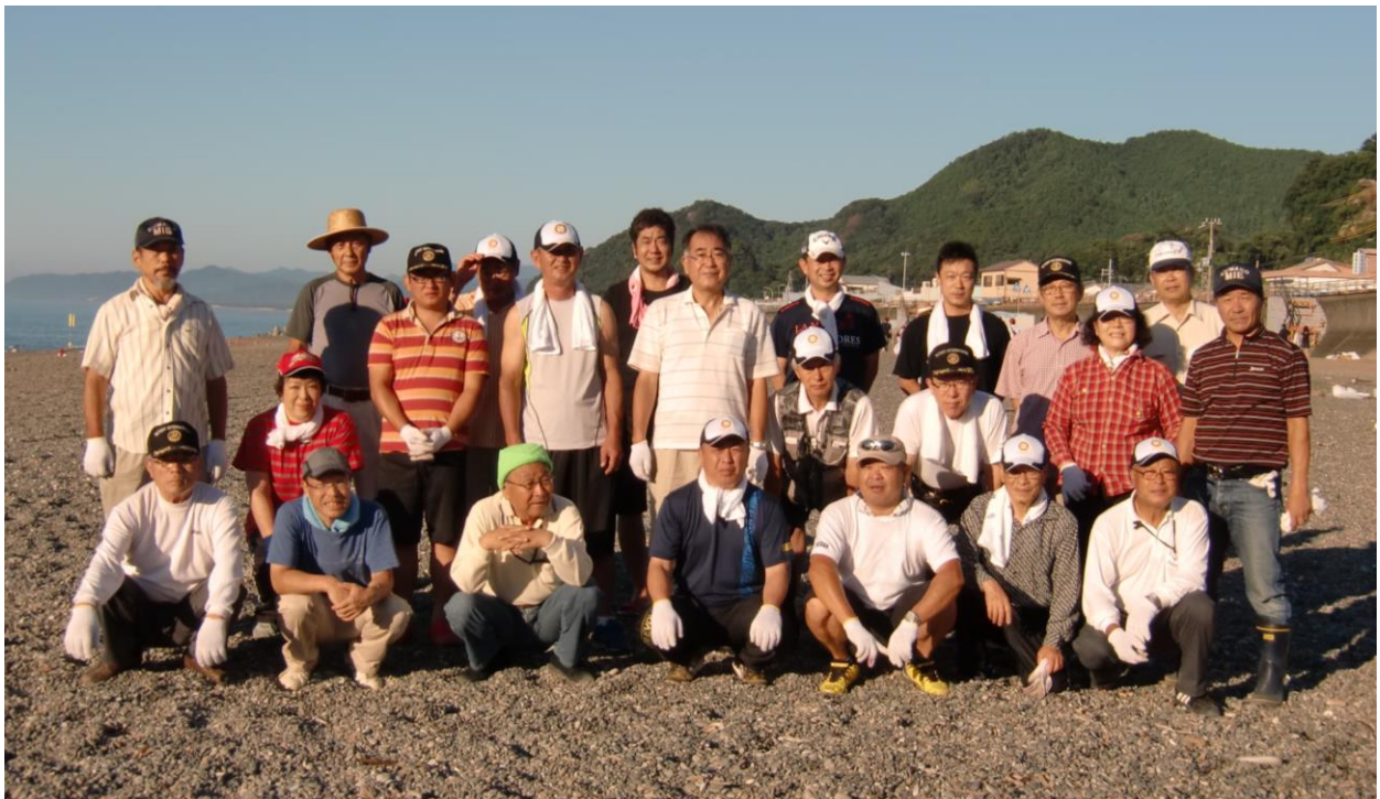
綺麗になった木本海岸にて朝日を浴びての清々しい集合写真。お疲れ様でした。