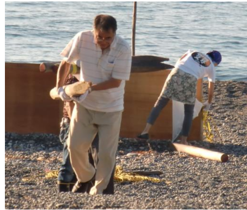
熊野大花火大会後の恒例の浜掃除会員のみなさん暑い中ご苦労様です。